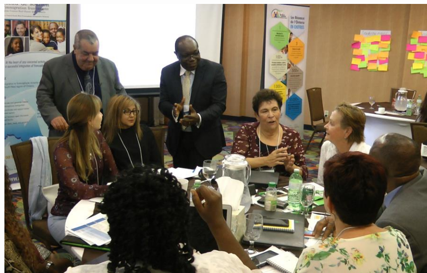
Sommet en établissement francophone, Centre-Sud-Ouest de l'Ontario, Octobre 2018