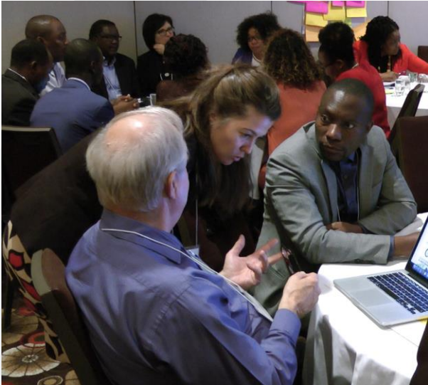
Photo: Sommet en établissement francophone, Calgary, Alberta, septembre 2018